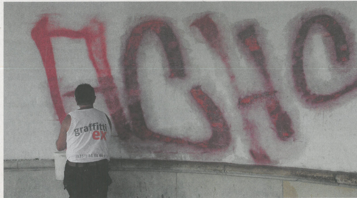
Eine chemische Graffiti-Entfernung ist schnell und schonend zum Baustoff.

Zu den Voraussetzungen einer chemischen Graffiti-Entfernung gehören ein Heißwasser-Druckstrahler und eine ganze Batterie von Spezial-Reinigungsmitteln. Diese sind auf die verschiedenen