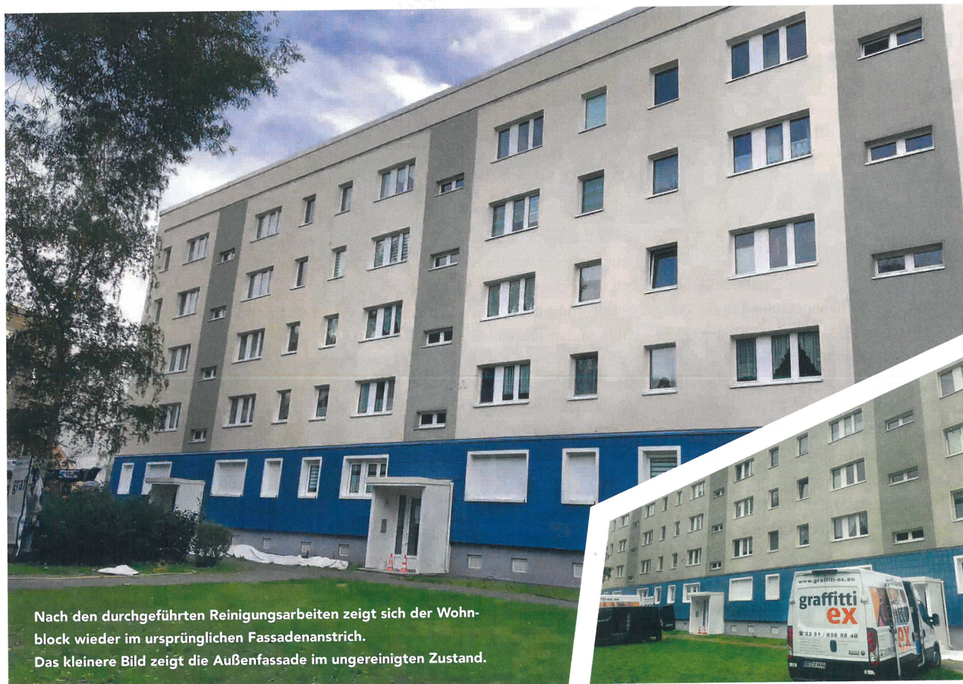
Nach den durchgeführten Reinigungsarbeiten zeigt sich der Wohnblock wieder im ursprünglichen Fassadenanstrich. Das kleinere Bild zeigt die Außenfassade im ungereinigten Zustand.